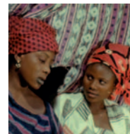
Seminario ROUCH: HOMBRE Y FUTURO (Y DEMÁS INCERTIDUMBRES)