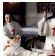
Seminario BUÑUEL: REALIDAD Y OTRAS PESADILLAS (SUEÑOS Y REALIDADES)