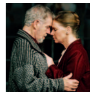
Seminario BERGMAN: PLACER Y CULPABILIDAD (EL GATO DE SCHRÖDINGER)