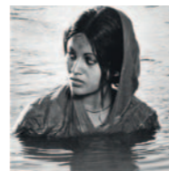
Seminario SATYAJIT RAY: LA LUZ EN LA NATURALEZA (INOCENCIAS)