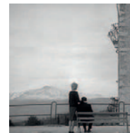
Seminario ANTONIONI: FENOMENOLOGÍA DEL VACÍO (NADAS)