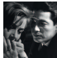
Seminario RESNAIS: LA ILUMINACIÓN DEL CEREBRO (MEMORIA Y OTROS OLVIDOS)