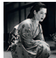
Seminario YASUJIRO OZU: LA LUZ EN EL RITO (Y EN LO COTIDIANO)