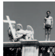
Seminario PASOLINI: EL NACIMIENTO DE LA TRAGEDIA (BIG-BANG)