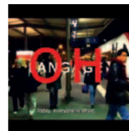
Seminario GODARD: EL CAOS A LA LUZ DE LA PALABRA (EL FIN DEL LENGUAJE)